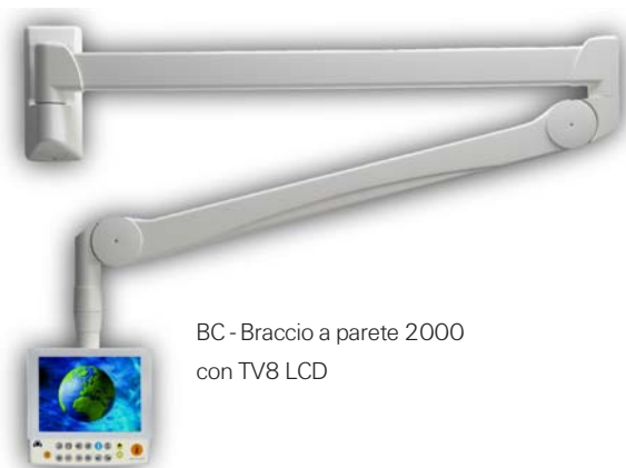
BC - Braccio a parete 2000 con TV8 LCD