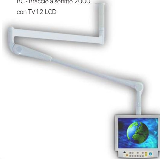
BC - Braccio a soffitto 2000 con TV12 LCD