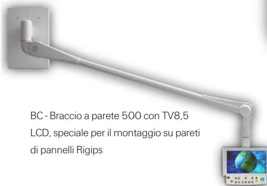
BC - Braccio a parete 500 con TV8,5 LCD, speciale per il montaggio su pareti di pannelli Rigips