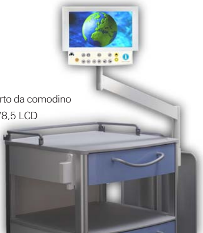
Supporto da comodino con TV8,5 LCD