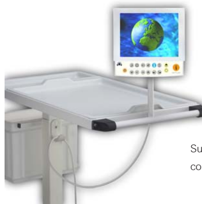
Supporto per tavolino con TV8 LCD

Perché qualche volta le cose sono un po' più complicate: soluzioni semplici per situazioni inconsuete.