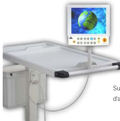
Support de table d'appoint avec LCD-TV8

Pour des tâches souvent un peu plus compliquées : des solutions simples pour des situations hors du commun.