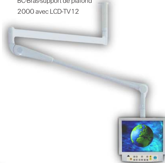
BC-Bras-support de plafond 2000 avec LCD-TV12