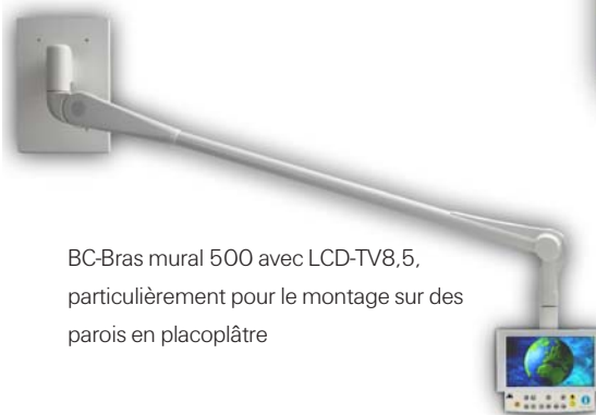
BC-Bras mural 500 avec LCD-TV8,5, particulièrement pour le montage sur des parois en placoplâtre