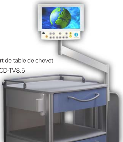
Support de table de chevet avec LCD-TV8,5