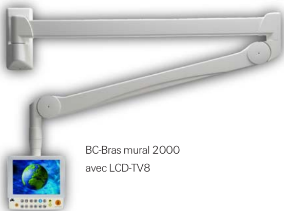
BC-Bras mural 2000 avec LCD-TV8