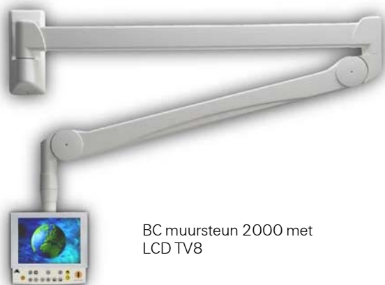
BC muursteun 2000 met LCD TV8