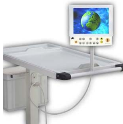
Steun voor zijkant tafelblad met LCD TV8.

Omdat soms zaken meer gecompliceerder lijken: eenvoudige oplossingen voor ongebruikelijke situaties.