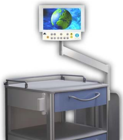
Steun voor nachttafel met LCD TV8.5