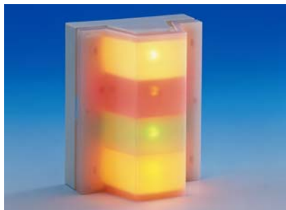
Blikající signalizační světlo a zabudovaná akustická signalizace upozorňují osoby v okolí na nouzovou situaci v prostoru WC.

Jakmile je v prostoru WC aktivováno tísňové volání, začne červeně blikat signalizační světlo umístěné přede dveřmi a rozezní se akustická signalizace. Upozornění na aktivované tísňové volání je tak viditelné a slyšitelné i v bezprostředním okolí WC.